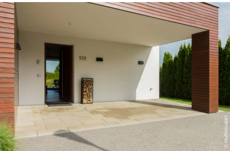
Überdachte Einfahrt für Rollstuhlnutzer