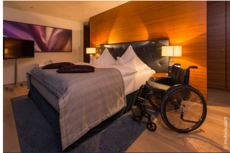
Großzügige Bewegungsfläche im Zusatzschlafzimmer

Das Badezimmer verfügt über eine bodengleiche Dusche mit den erforderlichen Haltegriffen und einen unterfahrbaren Waschtisch. Eine großzügige Sauna und ein Dampfbad bieten auch Rollstuhlnutzern ausreichend Bewegungsfläche. Durch eine flexible Raumgestaltung kann die barrierefreie Suite mit einem oder zwei Schlafzimmern gebucht werden. Auch der Außenbereich lässt keine Wünsche offen: Das Terrassendeck mit Whirlpool und dem sprudelnden Thermalwasser ist ebenso komplett schwellenlos. Ein Steg zur privaten Badebucht führt über eine Stufe, die jedoch mit einer Rampe ausgeglichen werden kann. Selbstverständlich steht zum Einstieg in das Badevergnügen ein Lift bereit.